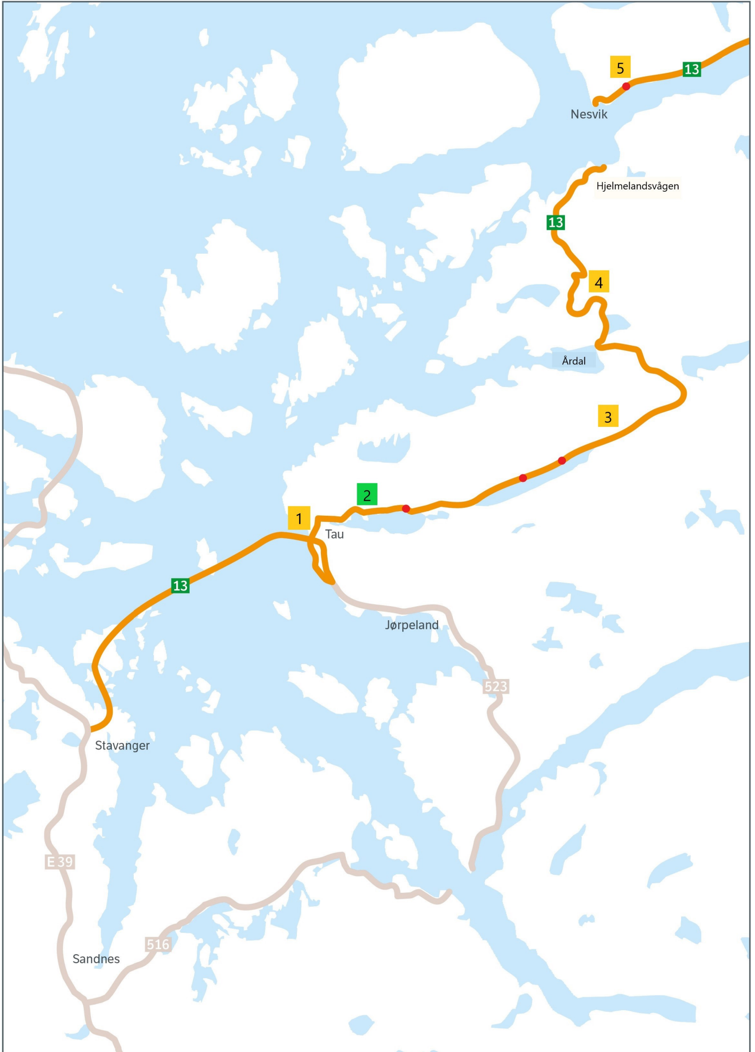
Kart 1 Stavanger - Sæbø