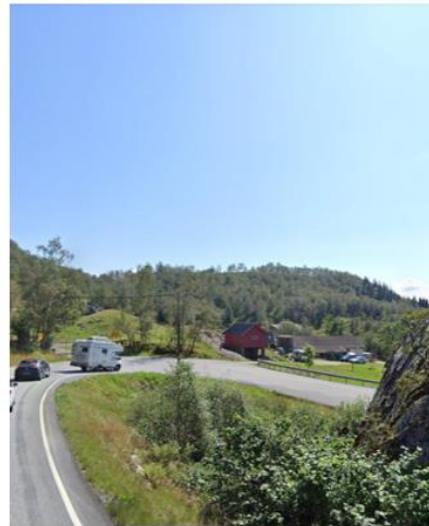
Ingvaldstadsvingen (Vedtatt reguleringsplan)