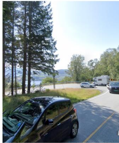
Hetlandsvingen (Vedtatt reguleringsplan)