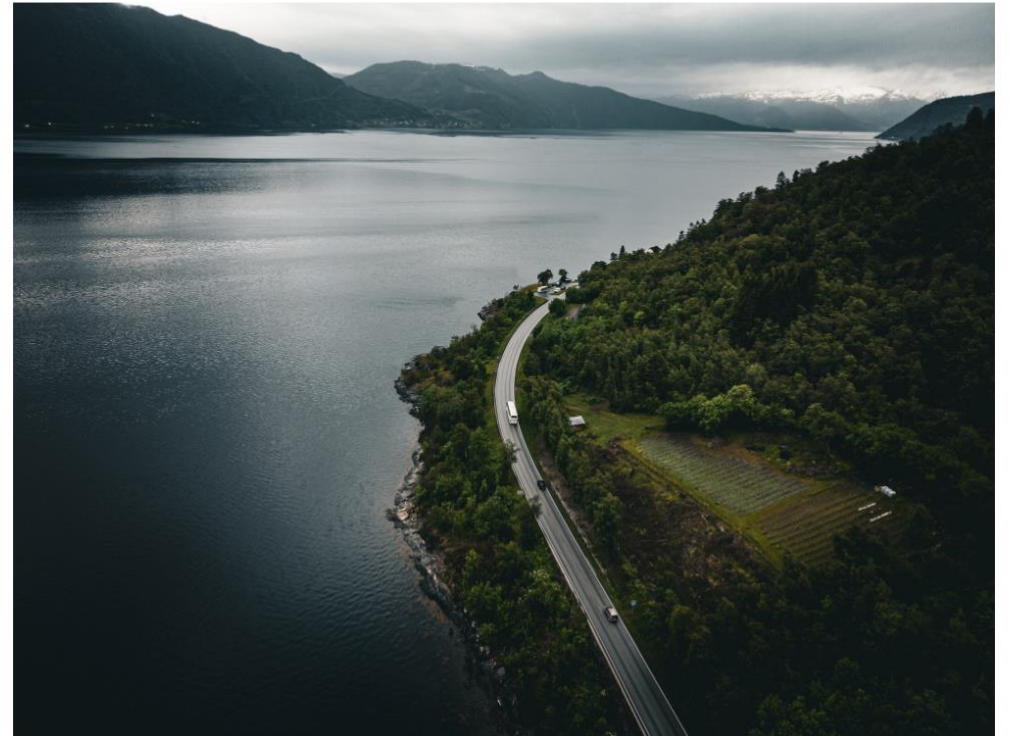
TUNNELARBEID: I kveld og komande natt blir det arbeid i to tunnelar mellom Sogndal og Leikanger.