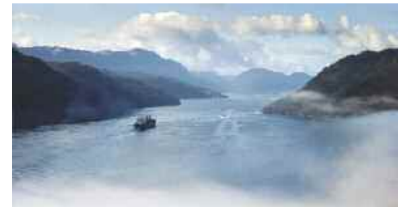
Utsikt sørover Saudafjorden fra turistvegen.