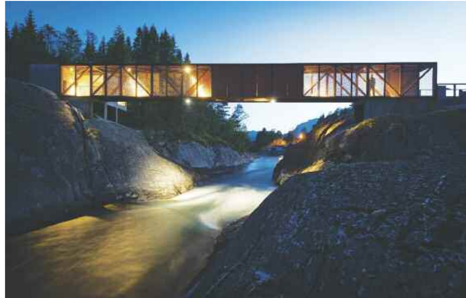
Høse bru, gangbru over Suldalslågen ved Sand i Suldal, en kort avstikker fra turistvegen.

Her er «Kvitebjørnen», en spennende opplevelsesutstilling for barn. Den 150 år gamle restaurerte ryfylke-jekten «Brødrene af Sand» ligger ved kai i sommersesongen. Her er også