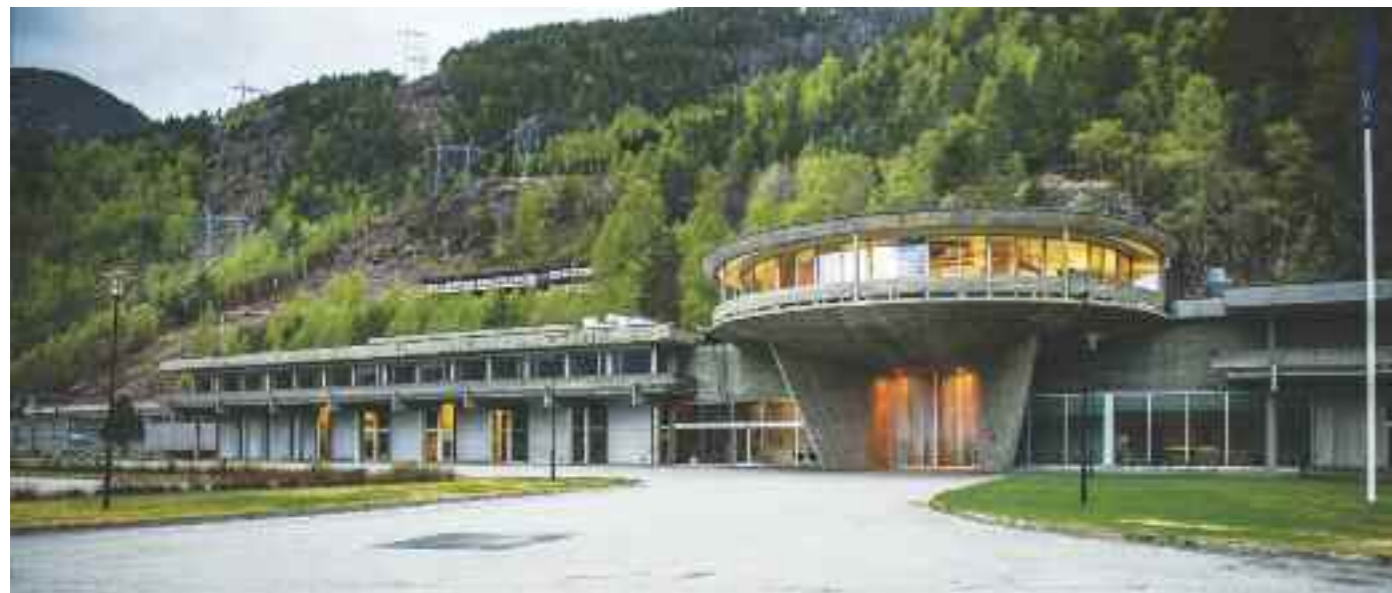
Særpreget arkitektur signert Geir Grung på Nesflaten. Driftssentralen til Hydro med Energihotellet i bakgrunnen. © Energihotellet