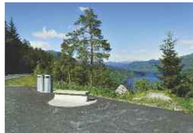
Enkel raste- og utsiktsplass ved Ås i Suldal, på fv 520.