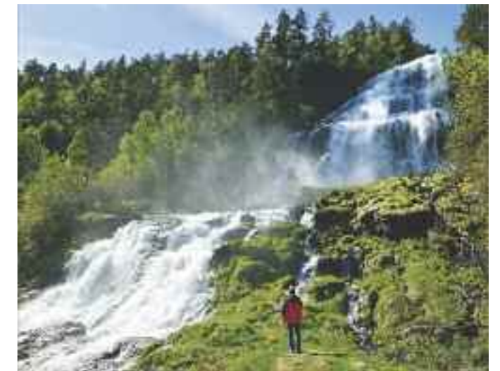
Trappevandringen tar deg opp til hovedfallet ved Svandalsfossen.