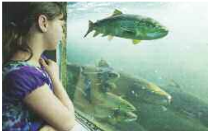
I Laksestudioet på Sand kan du se laksen på veg opp i elven for å gyte.