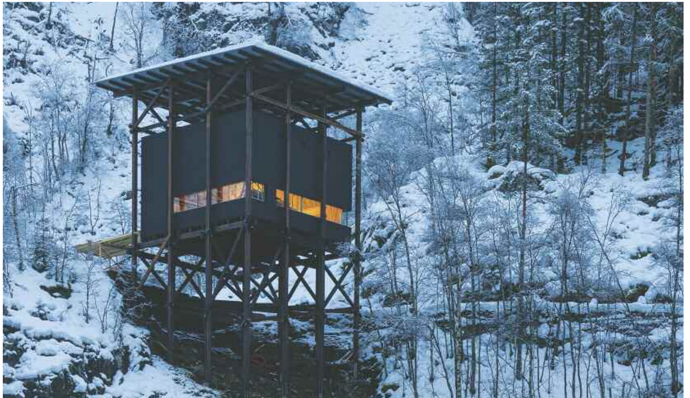
Et av byggene i Allmannajuvet under oppføring. Anlegget åpner til sommeren. Arkitekt: Peter Zumthor.

Turistvegen fortsetter videre i slynger over Saudafjellet til Røldal. Fjellovergangen, som er vinterstengt fra Hellandsbygd, går gjennom et skiftende og dramatisk landskap opp mot 900 moh. Snøen ligger ofte langt utover sommeren. Den smale vegen fra 1960 ble bygget med amerikansk kapital. Ofte vil du møte på geiter langs vegen, og det er flere fine turmuligheter i området. I september går ene etappen av sykkelrittet Tour des Fjords over fjellet her, og da har du sjansen til å se verdens-eliten rase over her. Du passerer Svartevassdammen, hvor