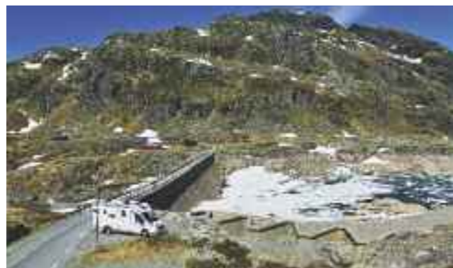
Vegen over fjellet mellom Sauda og Røldal går gjennom et karrig fjellterreng med mange knauser og tjern. Her ved Svartavatnet.

veien går på den 250 m lange damkronen. Ved Kringletjørn er du på 920 moh, vegens høyeste punkt, og kan se nordover mot Røldalssåta (1418 moh). Ved Gjertrudhidleren kan du se en gammel støl som ligger under en stor stein. Ved Hordalia er du kommet til turistvegens endepunkt, men ta gjerne turen innom Røldal og besøk stavkirken, som det knytter seg en rekke sagn til. Derfra kan du fortsette nordover til Låtefoss, som markerer startpunktet for Nasjonal turistveg Hardanger, eller gjør som oss – lag en liten rundreise tilbake til Sand, via Brattlandsdalen.