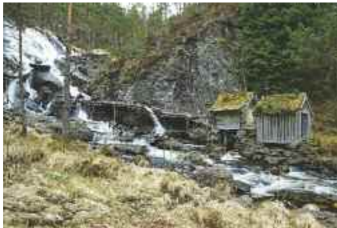
Kvednafossen, sagbruksmuseum ved Hustveit i Sauda, kort sideveg fra fylkesveg 520.