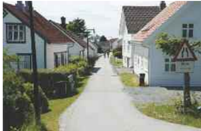
Det velholdte tettstedet Jelsa ved Sandsfjorden i Suldal på sideveg fra Nasjonal turistveg Ryfylke.

Ta gjerne et stopp på Lovra rasteplass på turen videre nordover, en enkel rasteplass med utsikt mot Lovraeidet og fjorden.