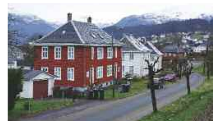
Bysamfunnet Sauda er bygget opp rundt Sauda Smelteverk fra 1920-tallet.