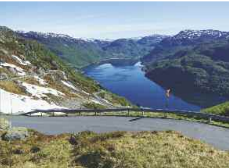
Utsikt fra Saudafjellet ned mot Røldal.

Åbøbyen er et amerikanskinspirert boligområde med ca. 120 hus som ble reist fra 1916 over en periode på 60 år. Noen av de som senere skulle bli noen av landets mest fremtredende arkitekter tegnet Åbøbyen. Byplanleggingen i Åbøbyen er preget av klasseskille. Flerfamiliehusene ligger nærmest fabrikkene. Lengst borte fra fabrikkene og røyken, ligger eneboligene for de høyere funksjonærene. Formenn og lavere funksjonærer fikk tofamiliehus. De første husene hadde i begynnelsen ikke strøm eller innlagt vann, men det tok ikke lang tid før dette var på plass. Hver leilighet fikk bad og vannklosett, noe som da var unikt i arbeiderboliger. Sauda kommune har i mange år arbeidet for å bringe nytt liv