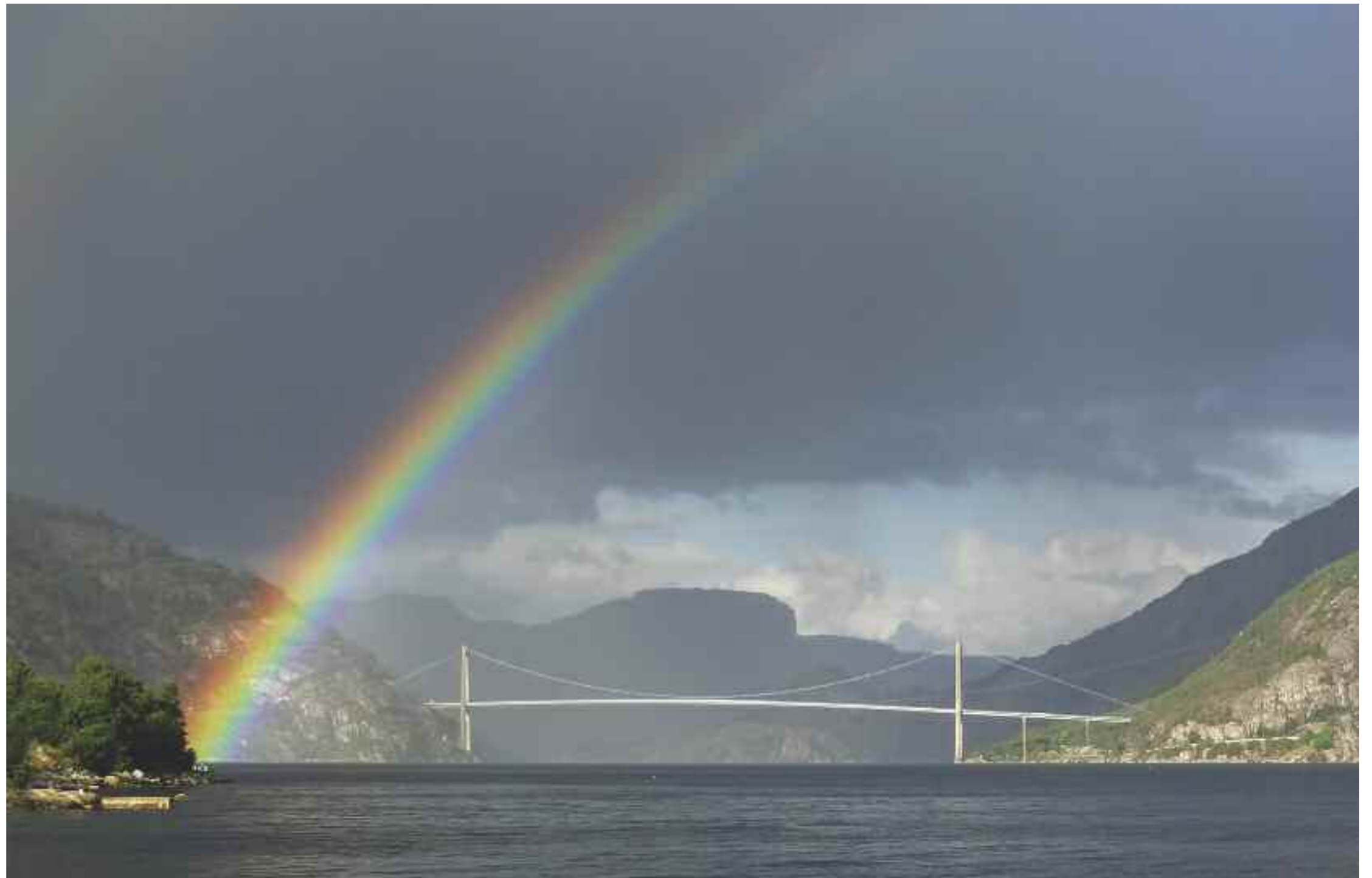
Brua over Lysefjorden ved inngangen til Nasjonal turistveg Ryfylke i sør.

guidet underveis, forbi fossefall, avsidesliggende gårder, det 1000 meter høye Kjerag-massivet med den kjente Kjeragbolten og den ikke mindre kjente Preikestolen. Kommer du fra Lauvvik, kan også en tur til Lysebotn og tilbake være verdt å spandere. Det går også cruisebåter på fjorden. Fergene går kun i sommersesongen. For tider sjekk visitlysefjorden.no . Husk å forhåndsbestille.