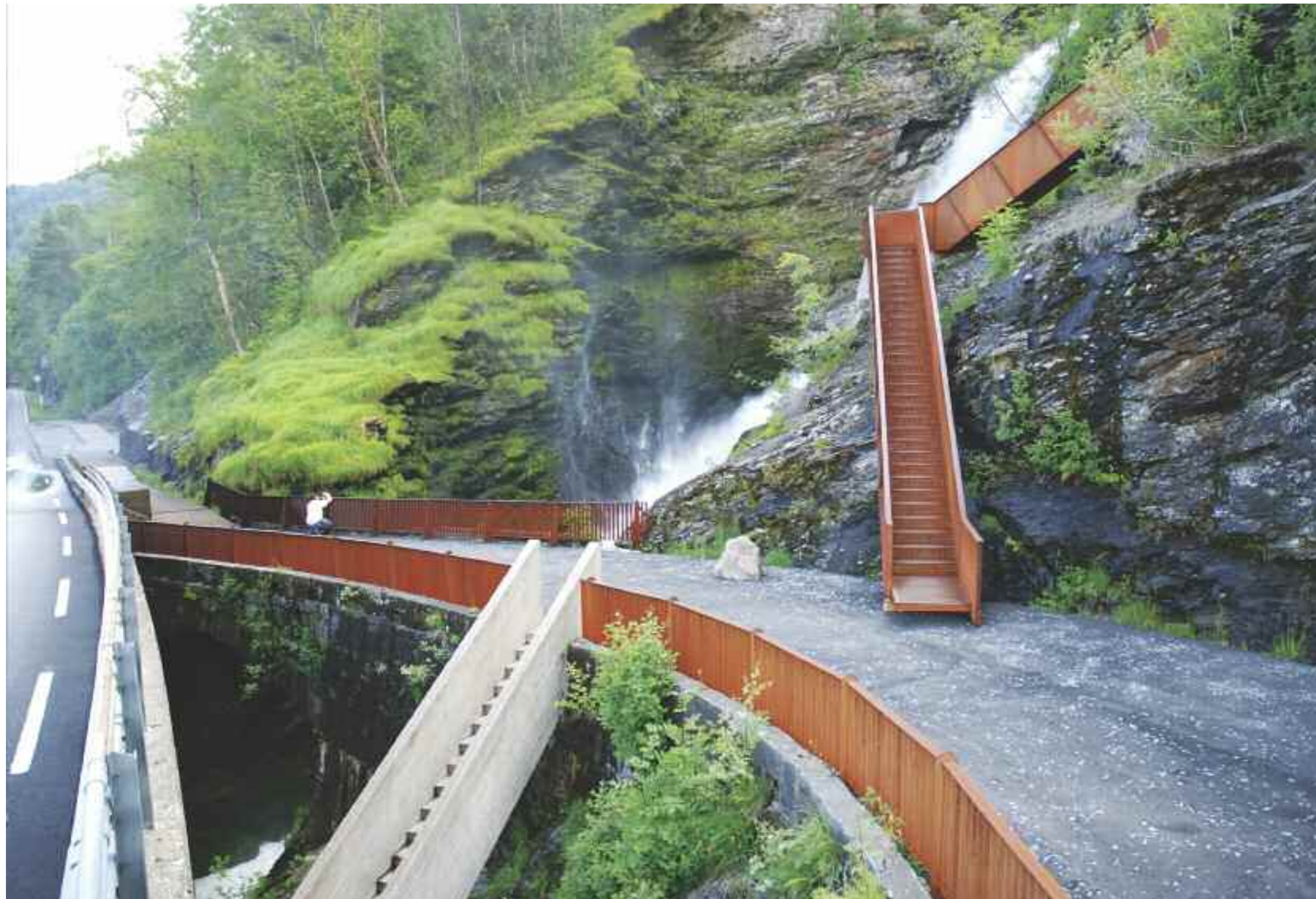
Trappevandring i moderne arkitektur ved Svandalsfossen i Sauda.

tid. Men tross både tømmer- og gruvedrift, startet ikke den virkelige industrialiseringen i Sauda før ut på 1900-tallet. I eksplosivt tempo ble det et moderne industrisamfunn, og siden 1923 har Sauda Smelteverk vært hjørnesteinsbedriften. Spillvarme fra anlegget brukes til å varme opp bassenget i bygda, og til å tine snø og is i gatene om vinteren. Amerikanerne så muligheten for å investere stort pga de enorme kraftressursene.